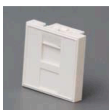
ZKS 1103-018 45X45 FACEPLATE