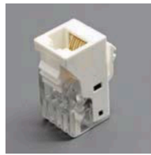
CAT3 RJ 11-12 KEYSTONE JACK