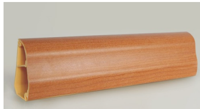
50X28 KİRAZ SÜPÜRGELİK KANAL