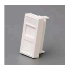
ZKS 1107-018 45X22,5 FACEPLATE