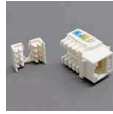
CAT5 RJ45 KEYSTONE JACK