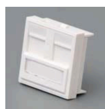
ZKS 1204-018 45X45 FACEPLATE ÇİFTLİ