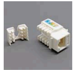
CAT6 RJ45 KEYSTONE JACK