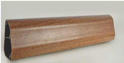
50X28 GÖLE CEVİZ SÜPÜRGELİK KANAL