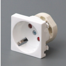
ZKS 1101-018 45X45 ŞEBEKE PRİZ