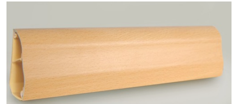
50X28 KAYIN SÜPÜRGELİK KANAL