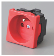
ZKS 1102-018 45X45 UPS PRİZ